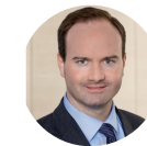
Hans-Wilhelm Dünn Präsident Cyber-Sicherheitsrat Deutschland e.V