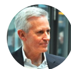
DREES & SOMMER